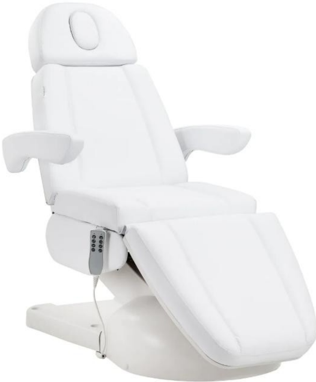
Azzurro Lux kosmetikstol 4m