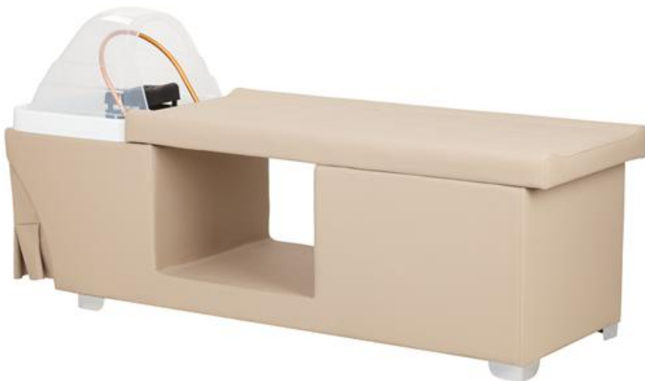
Gabbiano Head Spa Maldiverna